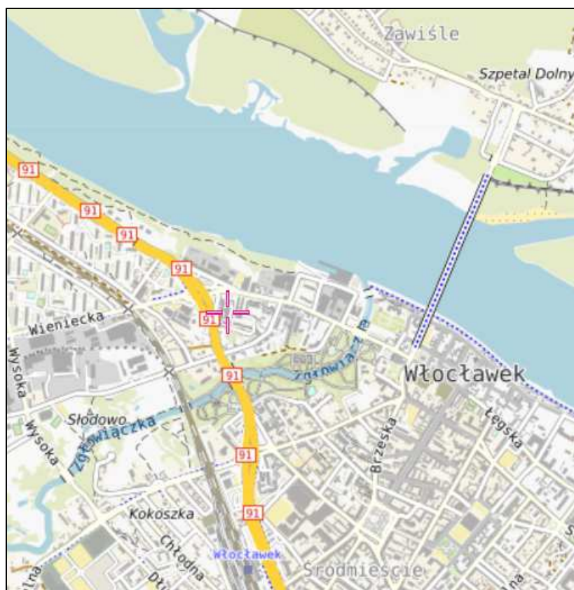
Rys. 1 Lokalizacja badanego obiektu