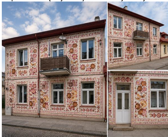
Kamienica przy ul. Łęskiej 24.

Do tworzenia kafli na kamienice można by zaprosić wszystkie malarki – zarówno te pracujące w obecnych fabrykach (uwzględnić, że koniecznością byłby udział obu fabryk, wbrew wszelkim niesnaskom), a także te, które już nie są zawodowo aktywne, ale np. są zrzeszone w Towarzystwie Miłośników Fajansu Wrocławskiego. Można by nawet urządzić konkurs na najpiękniejszą kamienicę – jako formę współzawodnictwa dla fabryk czy ogólnie grup malarek. Mogłaby to również być forma aktywizacji dla chętnych