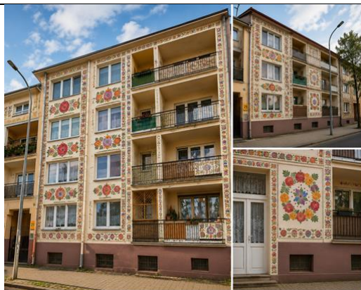
Blok przy ul. Starodębskiej 21. Wzory mogą wydawać się dalekie od wrocławskich – a jednak inspirowane są najstarszymi dekoracjami – jeszcze z fabryki Teichfelda i Asterbluma.