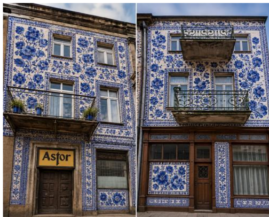
Kamienice przy ul. Tumskiej 5 i 7.